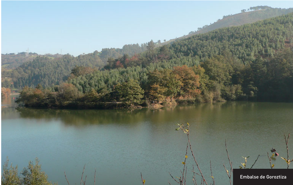
Embalse de Gorostitza